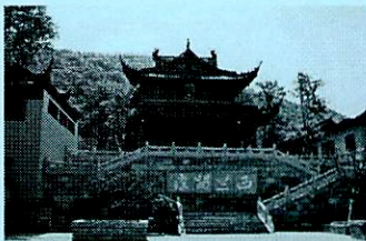
「錫恵公園(イメージ)」

江蘇省南部の長江デルタ地帯に位置し、3000年の歴史を擁する古都。北に長江が流れ、南に太湖を望むこの街は、古くから漁獲と米の収穫が豊かな土地として知られる街です。見所は中国で4番目に大きい淡水湖の太湖をはじめ、山水が織りなす数々の景勝地です。最近では時代劇やドラマ・映画の撮影場所としても使われています。