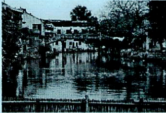
「同里景観(イメージ)」

また周荘や用直と並び、江南水郷三明珠と称されています。街で水が占める面積は総面積の五分之一。五十近い橋が街の風景に風情を添えている。一番小さい橋は三尺足らずの「独木橋」、最も古い橋は「思本橋」で700年以上の歴史を持っています。