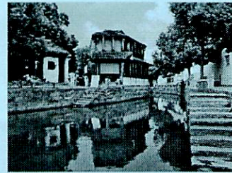
「同里景観(イメージ)」