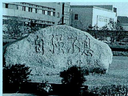
上海大学キャンパス (イメージ)